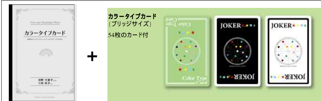
カラータイプカード (ブリッジサイズ) 54枚のカード付